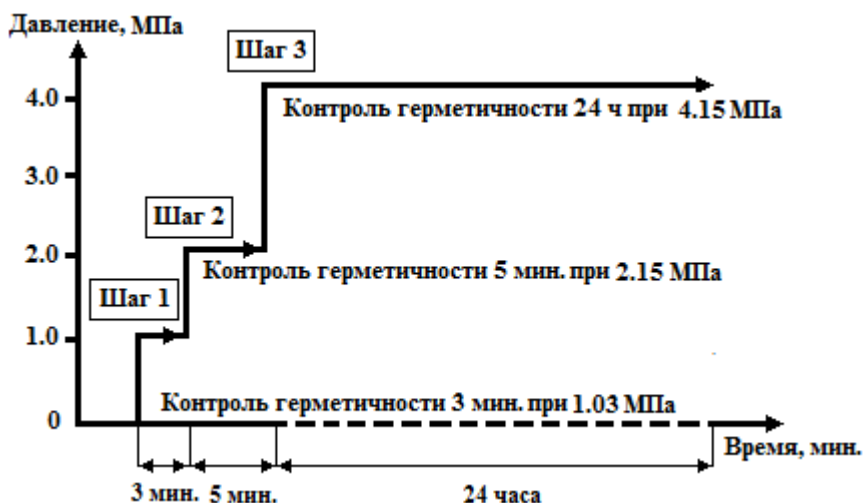
Рисунок 2 - Проверка герметичности азотом хладагента R 410A

5.5.6 Неплотности допустимо выявлять путем обмыливания медных труб, их разъемных соединений с испарительным блоком и компрессорно-конденсаторным блоком, а также паяных неразъемных соединений медных труб мыльной пеной с добавкой глицерина и последующим наблюдением за появлением пузырьков в местах неплотностей.